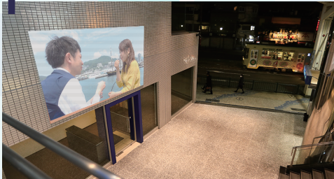
120インチ大画面プロジェクター

お店のウリや雰囲気動画を紹介！ 大画面で高解像度ですので、 貴店の自慢がリアルに伝わります!!