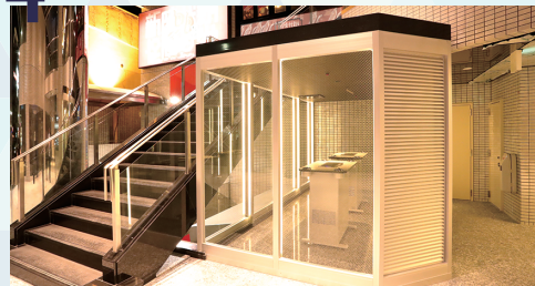
愛煙家も安心の喫煙ルーム

お店もおタバコも、どちらも気軽に楽しめるよう 独立した衛生的な喫煙ルームを設置しました。