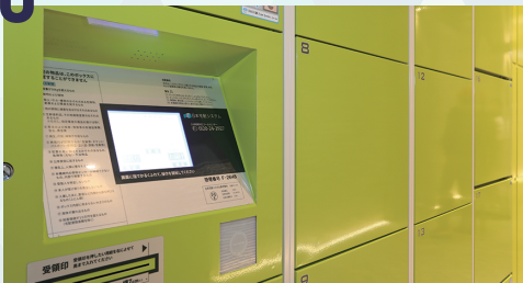
宅配ボックス完備

こだわりの生産者様から直接届く 食材や酒類も、専用の宅配ボックスで、 安心のお取引をお手伝いいたします！