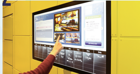
高輝度タッチパネルでお店紹介

高輝度のタッチパネルを設置！ お店の紹介や料金システム・営業時間など掲載 することができます。英語にも対応しています。